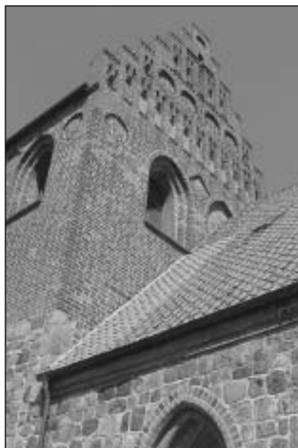
Ballerup Kirke.

Kirken ligger centralt placeret på en mindre forhøjning i den sydlige del af den gamle bondelandsby. De ældste dele stammer fra perioden 1200–1250.