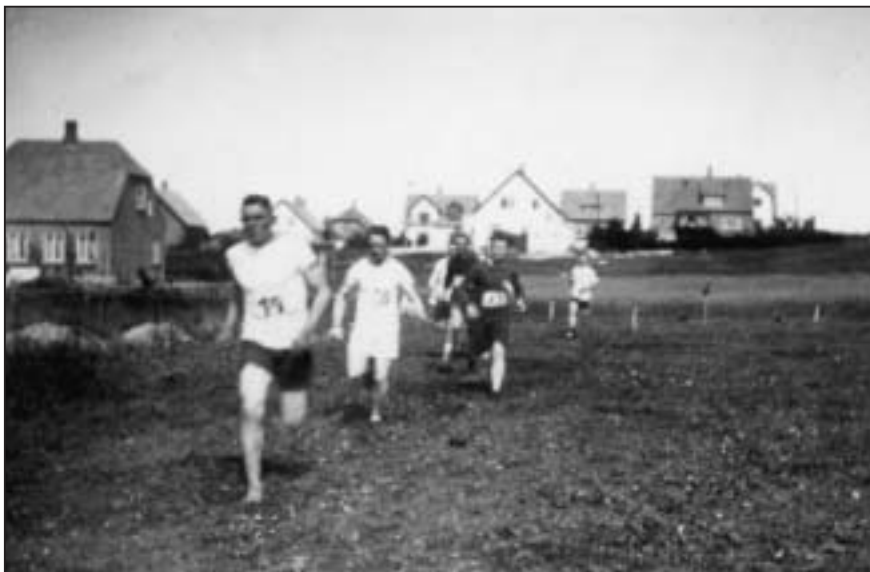
Atletik på den gamle boldbane ved Solvej. Foto, 1919.