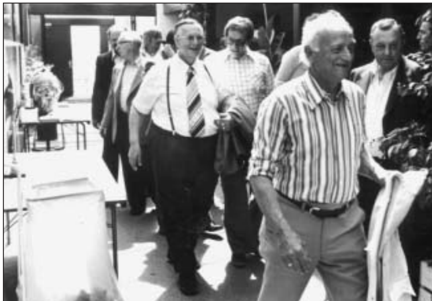
BIF's 50 årsdag blev fejret i klubhuset i Idrætsparken med besøg af bl.a. borgmester Burchardt. Foto, 1977.