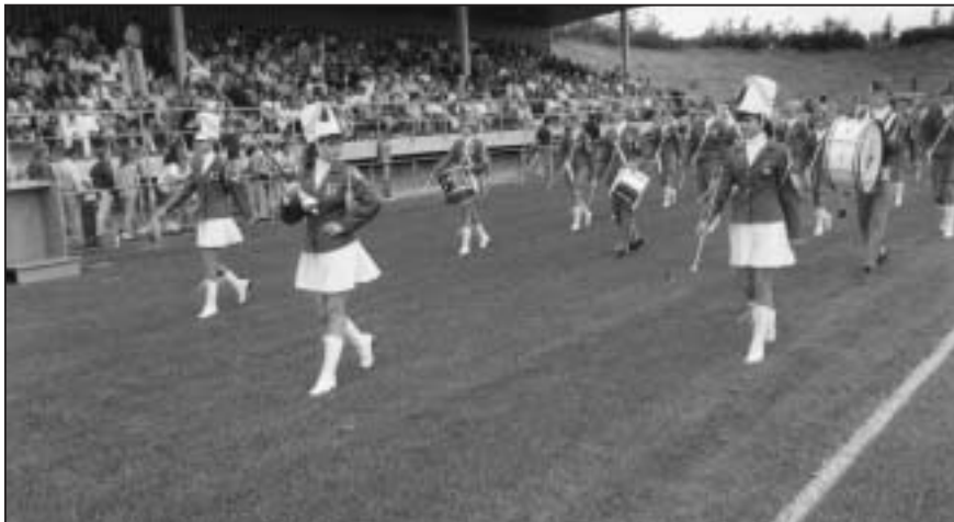
Indvielse af den nye tribune i Ballerup Idrætspark med Ballerupgarden som gæster. Foto, 1985.