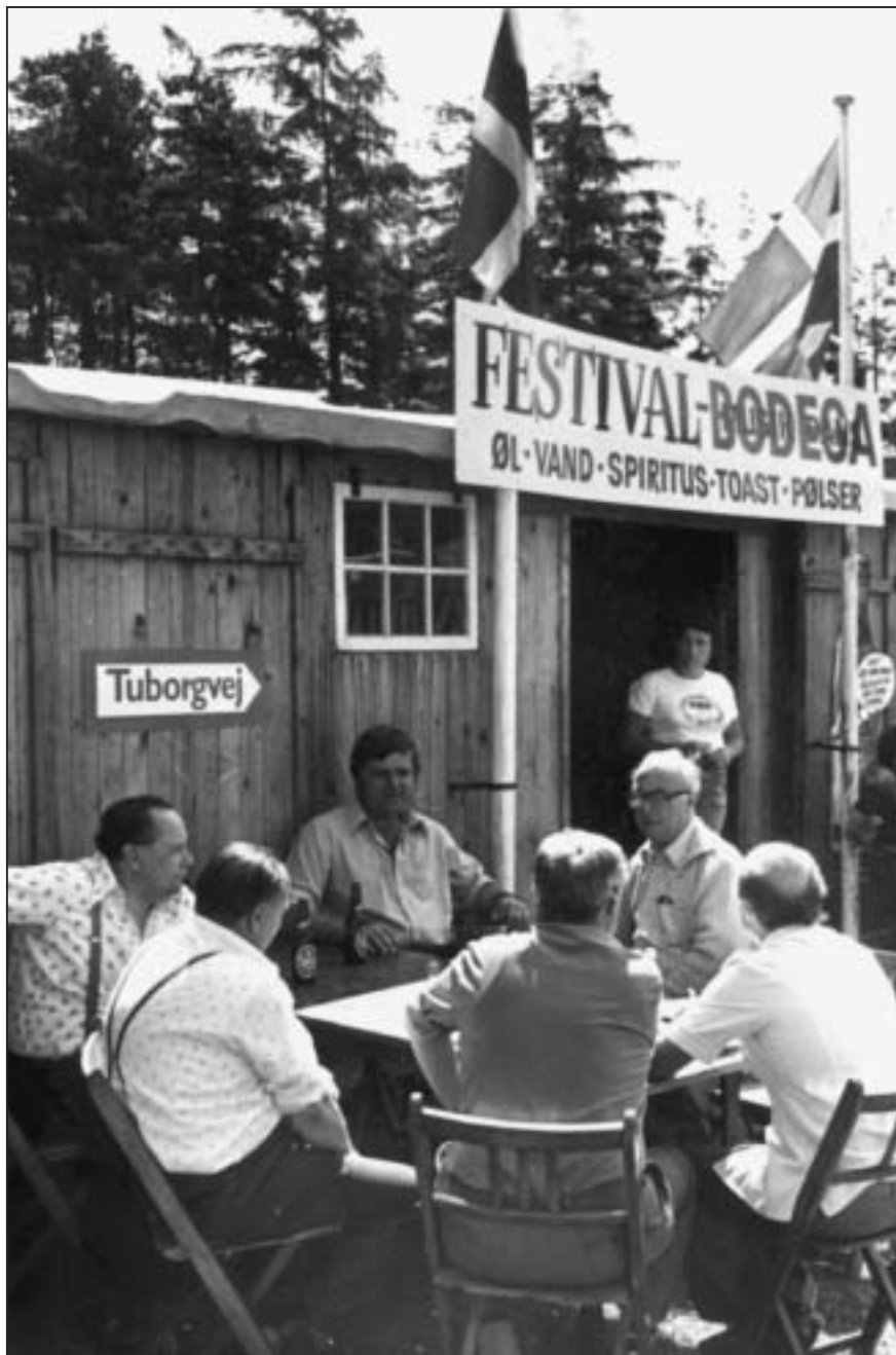
Sommerfesten i Damgårdsparken i 1966 bød på gratis sildebord om søndagen.