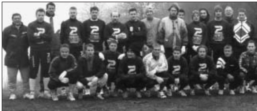
AC Ballerups spillertrup i danmarksserien. Foto, 1998.

AC Ballerup. Det betød, at den licens, som Skovlunde IF havde, da AC Ballerup startede, nu tilfaldt BIF, der nu var den højst rangerende klub af de fire, der er i dag.