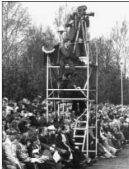
Pokalkvartfinalekamp mod Holbæk med tv og rekordpublikum på 4.500 tilskuere i Damgårdsparken. Foto, 1975.