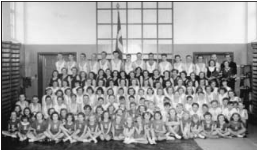
Ballerup Gymnastikforenings gymnaster i Parkskolen.

juniorhold, der blev kredsvindere. 1. holdet var kun et straffespark fra oprykning. Det blev brændt to minutter før tid.